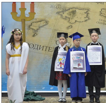
ОТКРЫТИЕ ПОЗНАВАТЕЛЬНЫХ ОЛИМПИАДСКИХ ИГР МЛАДШИХ ШКОЛЬНИКОВ

В гимназии имеется уникальный опыт работы по созданию единой информационной образовательной среды (ЕИОС), которая позволяет связать воедино всех участников образовательного пространства и обеспечить полнофункциональные автоматизированные рабочие места ее сотрудникам. Она обеспечивает непрерывность образования и строится на принципах удобства, безопасности, оперативности, полной информированности об ученике и для ученика, а также включения родителей